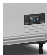
Digitální ukazatel teploty