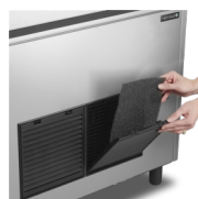
Snadné čištění filtru kondenzátoru