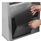
Snadné čištění filtru kondenzátoru