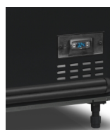
Digitální ukazatel teploty