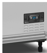
Digitální ukazatel teploty