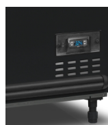
Digitální ukazatel teploty