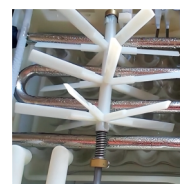
Mechanismus pro pohyb vody

INSTALACE: pitná voda (teplota mezi +5 až +40 °C), není nutná instalace změkčovače, tlak vody 1 až 5 barů, odpad vody minimálně 50 mm pod výpustí výrobničku do vzdálenosti 1 m, v jiném případě nutno instalovat výrobničku na podstavec