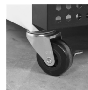
Pevná kolečka jako volitelné příslušenství