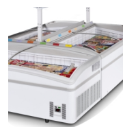
Instalace do ostrovů, police jako příslušenství