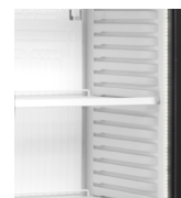
LED osvětlení uvnitř rámu dveří

Chladicí skříň jednodveřová s prosklenými dveřmi