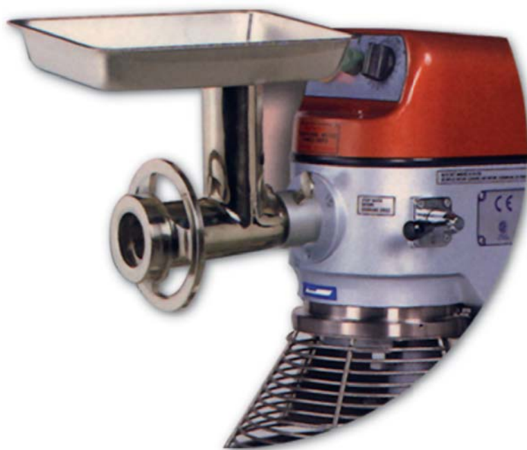
MLÝNEK NA MASO