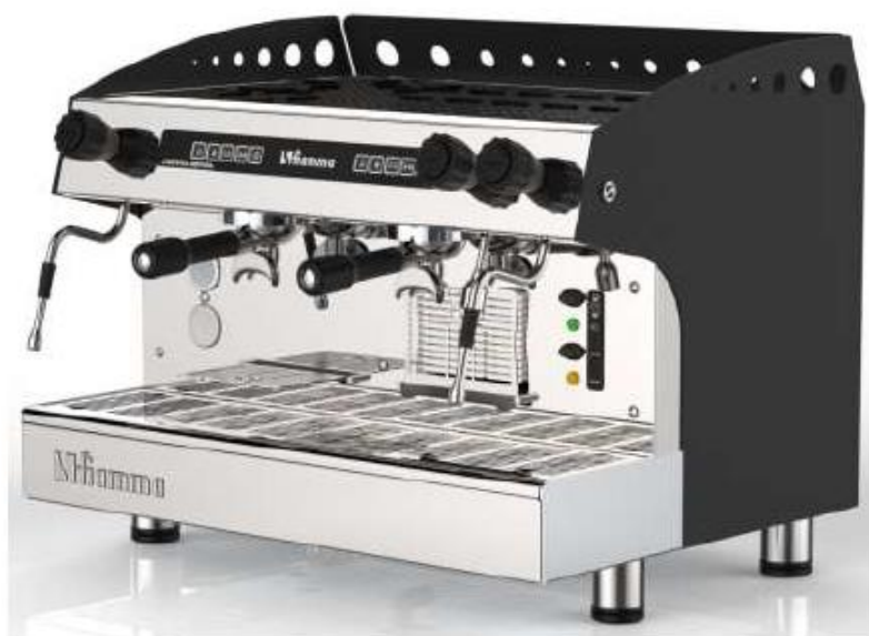
Kávovar pákový CARAVEL III CV TC