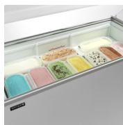
Na objednávku: koš na vaničky na zmrzlinu