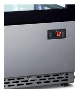
Digitální ukazatel teploty